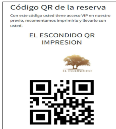
Figura 2: Captura de la pantalla Código QR de reserva - Aplicación Móvil

todos los datos e información de la reservación que realizó el usuario.